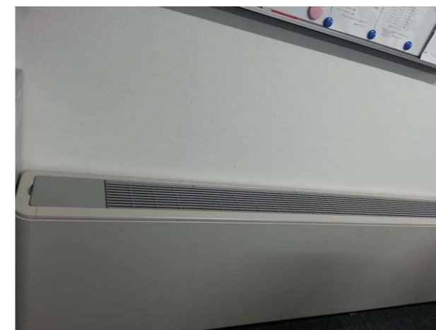
地中熱空調システム室内吹出口①