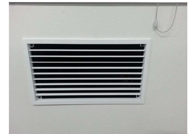
地中熱空調システム室内吹出口②