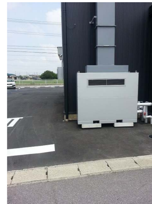
地中熱空調システム本体