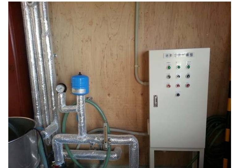
地中熱空調システム制御基板